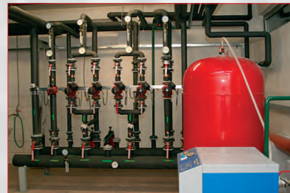
ACSS spol. s r.o. Bratislava: Nízkotlaká teplovodná plynová kotolňa. Nízkotepelné kondenzačné kotle Froling, horáky pretlakové Weihaupt a automatika MaR Siemens PRU.